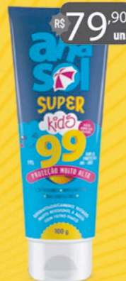
Anasol Protetor Solar KIDS FPS 99 - 100g