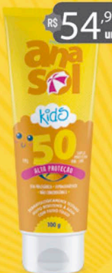
Anasol Protetor Solar KIDS FPS 50 - 100g