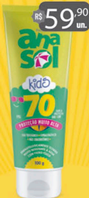
Anasol Protetor Solar KIDS FPS 70 - 100g