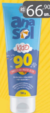
Anasol Protetor Solar KIDS FPS 90 - 100g